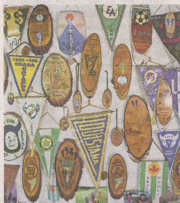
PLACKY A VLAJKY To jsou jedny z nejcennějších trampských artefaktů.

Zalomení palců – trampský pozdrav spočívající v podání pravice a následném zaháknutí palců, neplést s mnohem novějším pozdravem raperů