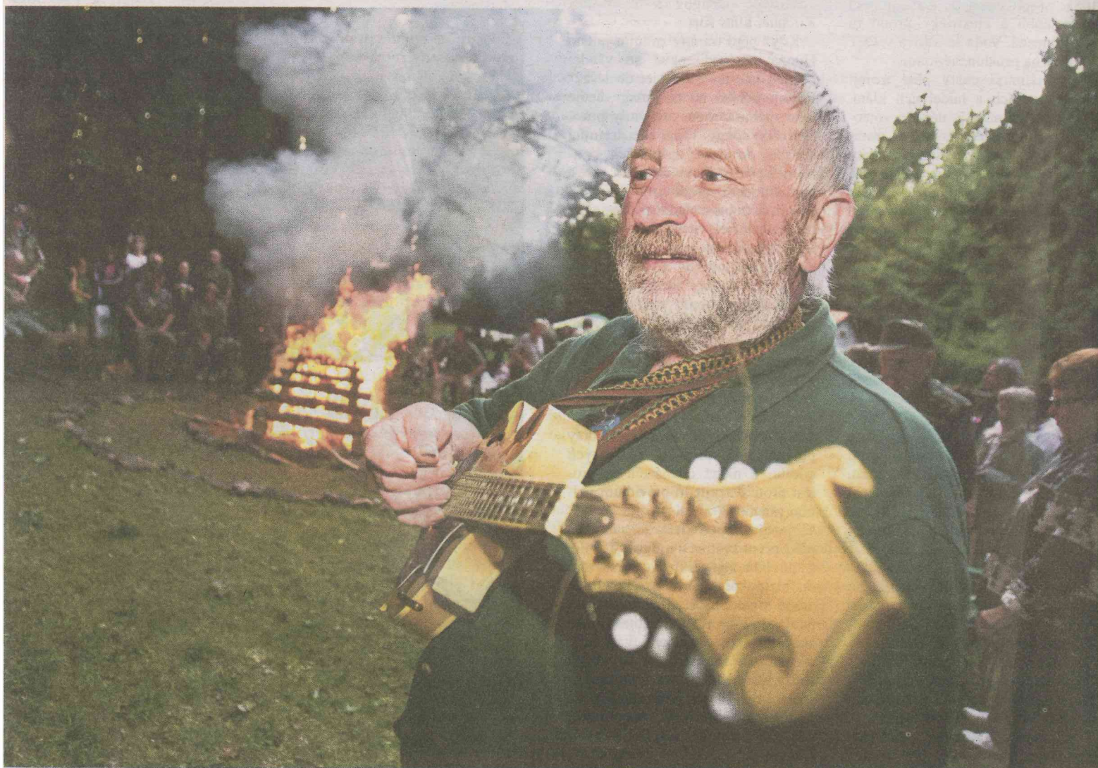
POTLACH Trampové z Údolí hadrů a spřátelených osad se sešli, aby oslavili zpěvem oblíbených songů devadesát let své existence.